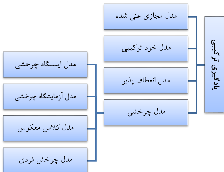
(شکل ۱: مدل های یادگیری ترکیبی)

ترکیب کلاس معکوس با یادگیری برخط، نوعی یادگیری ترکیبی است که در دهه گذشته ایجاد شده است و تحقیقات مربوط به آن به عنوان فرصت های یادگیری که فقط به حضور رودرو متکی نیست همچنان در حال پیشرفت است. برخی از مطالعات انجام شده نتایج مثبتی مانند یادگیری خود تنظیم، انگیزه و رضایت از حضور در کلاس توسط فراگیر و ... را نشان می دهد. رویکرد کلاس معکوس الگوهای یادگیری را تغییر می دهد و فعالیت های کلاسی همچون توضیح مطالب و ارائه تکلیف را به خارج از کلاس منتقل کرده و کلاس درس محلی برای یادگیری مبتنی بر حل مسئله تمرین و بحث و تعامل فراگیران با یکدیگر و با معلم خواهد بود (Cheng, Ritzhaupt, & Antonenko, 2019). بنابر نظر چارمون 'یادگیری معکوس را می توان به چهار قسمت دسته بندی نمود که در شکل ۲ نشان داده شده است (Chaeruman et al, 2020).