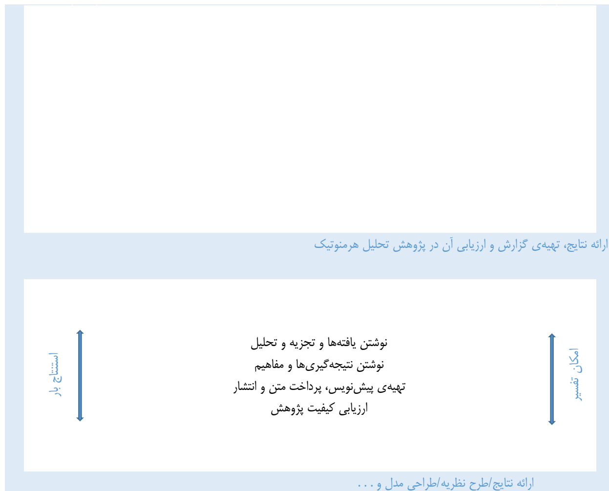
شکل ۱- مراحل انجام پژوهش تحلیل هرمنوتیک (خنفر و مسلمی، ۱۳۹۶، ص. ۲۷۷)